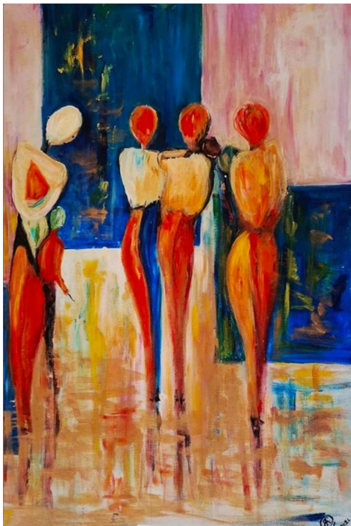
WOMEN BORN of COLOR SHAPED by STRENGTH

«Άκου, Μίλα, Δράσε: Μαθητικές Καλλιτεχνικές Δημιουργίες για την Έμφυλη Ισότητα»